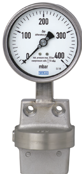
Пример на фотографии, модель 732.51.100 по ATEX