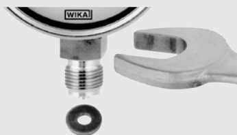
Монтаж при помощи рожкового ключа

Измерительные приборы должны быть заземлены через присоединение к процессу. Поэтому для присоединения к процессу необходимо использовать уплотнения, проводящие электричество. В противном случае примите другие меры для обеспечения заземления. При ввинчивании прибора усилие, необходимое для герметизации, должно прилагаться не через корпус, а только через плоскости предусмотренного для этого ключа, используя подходящий инструмент.