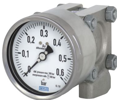
Пример на фотографии, модель 732.14.100 по ATEX